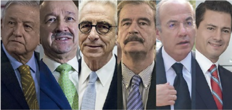
AMLO vs los presidentes del neoliberalismo

Escrito por Salvador González Briceño Martes, 27 de Octubre de 2020 23:06