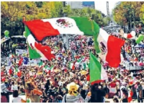
El pueblo, el único garante de la soberanía.