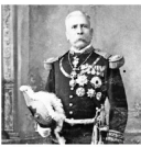
Porfirio Díaz, presidente, apoyó el regreso de capitales extranjeros a México, reduciendo así la deuda.