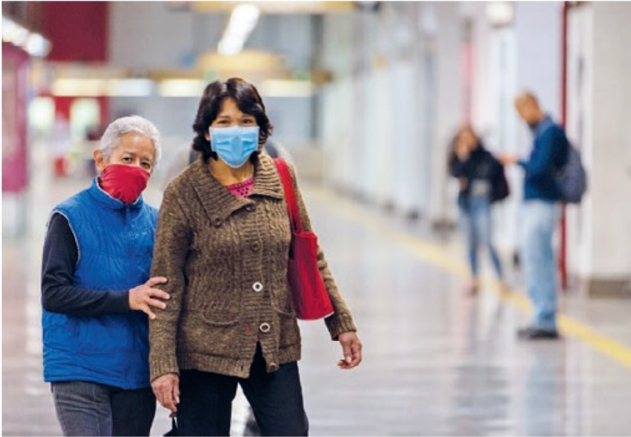
El Covid-19 puso en jaque al sistema de salud en la globalización.