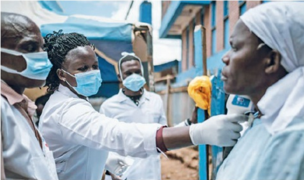
Global, la amenaza es mayor en los países pobres del planeta.

Escrito por Rodolfo Ondarza Viernes, 29 de Mayo de 2020 22:44