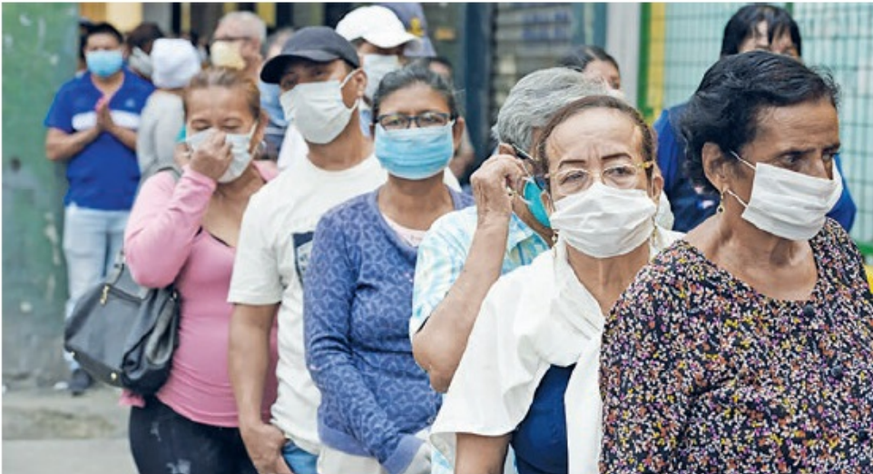
Amenaza para la sociedad, reto para la salud pública y los gobiernos.

El COVID-19, el nuevo coronavirus, se ha convertido en una pandemia global. Los países en desarrollo han