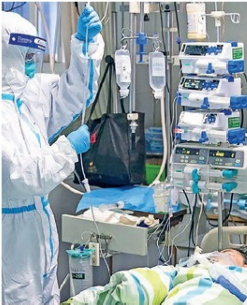
La OMS advierte sobre los riesgos de levantar las cuarentenas.

El personal de salud hace un esfuerzo sobrehumano en la primera línea de batalla, para atender apropiadamente y oportunamente a los pacientes con COVID-19, mientras se ponen a sí mismos en riesgo de contraer la infección.