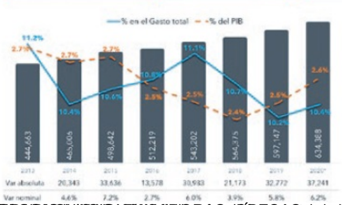
FUNCIÓN SALUD (MDP)

El gobierno ha implementado diversas medidas para reducir los costos de la salud, pero aún queda mucho por hacer para garantizar un acceso equitativo y asequible a los servicios médicos.