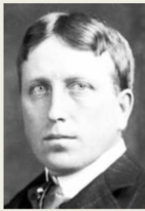
William Randolph Hearst.