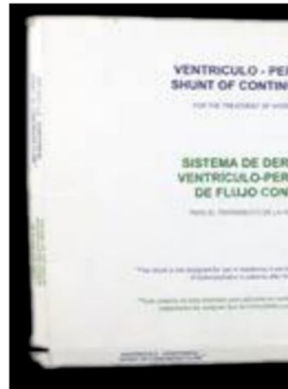
Empaque del Sistema de Derivación