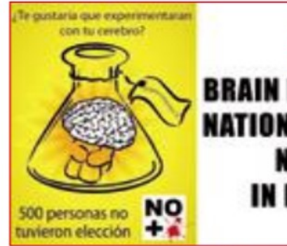
Cartel de denuncia