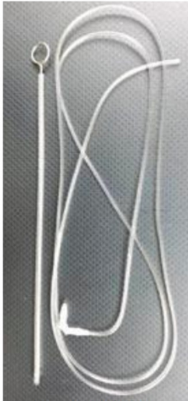
El invento de Julio Sotelo.