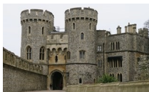
Castillo de Windsor.

Por ejemplo, la familia Prescott es una de las más poderosas de Chicago. La señora Prescott de Chicago tiene un escaño como miembro en la Administración de Obama. Todos ellos junto con la familia Crown de Chicago Illinois, forman enormes familias dueñas de agencias de propiedades y de bancos, las que han sido investigadas y vinculadas con el lavado de dinero, una y otra vez. Así que los Prescott, los Crown y George Soros apoyaron y dieron a estas organizaciones desconocidas el empuje inicial en la política en Illinois, en la casa legislativa del Estado, y desde allí ejercieron presión al senado de Estados Unidos en 2004.