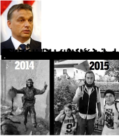
Un combatiente de las yihadistas después de desplantar a una joven Kurda en la ciudad de Kobani en Siria en 2014. Un suñatista asesino fundamentalista Musulmán se arroja a las virtudes y generosidad que ofrece la comunidad europea a los refugiados sirios y otros. Hay aparece en esta imagen distrahendo con sus hijos lo que le brindan los países infieles, según su creencia. Con la llegada de cientos de miles de refugiados al Ejército Islámico y otros grupos radicales, introdujeron varios miles de combatientes para futuros actos heroicos que seguramente cometerán contra inocentes por la generosidad y compasión de los

Escrito por Regino Díaz Redondo Domingo, 25 de Octubre de 2015 12:26