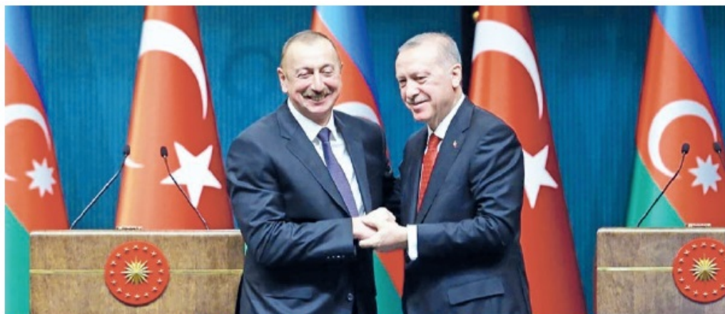
Tayyip Erdoğan, con el presidente azerbaiyano Ilham Aliyev, su homólogo en la guerra