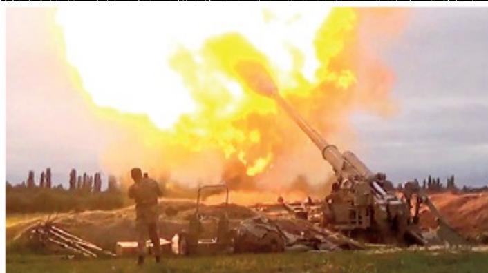
Azerbaiyán y Armenia, en guerra por Nagorno Karabaj.