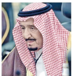
Debido a la epidemia de coronavirus, el rey saudí de Arabia Saudita, de 84 años y ya afectado por el mal de Alzheimer, está bajo confinamiento en un palacio cerca de Riad. Su sucesor deberá esperar una tibia guerra de sucesión en el reino.

Así que Estados Unidos convenció a la Unión Europea para que se sumara a una operación del tipo «Operation Just Cause» —denominación estadounidense de la mencionada invasión de Panamá—. Durante tal operación serían secuestrados el presidente de Venezuela, Nicolás Maduro, y el segundo dirigente político más importante del país, Diosdado Cabello, vicepresidente del Partido Socialista Unido de Venezuela (PSUV). Reino Unido, Francia, España, Portugal y Países Bajos —las potencias occidentales que tuvieron presencia colonial en Latinoamérica— se ofrecieron para participar en la operación. La siguiente secuencia resulta reveladora.