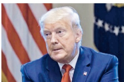
Foto: el presidente Donald Trump. No Aguado el momento de la sesión.

Riad y Washington libran una prueba de fuerza que ya estaba desorganizando la economía mundial antes de que se extendiera el coronavirus. El presidente Donald Trump se plantea apoderarse del control del petróleo de Arabia Saudita y de Venezuela, lo cual parece haberlo llevado a establecer nuevas alianzas.