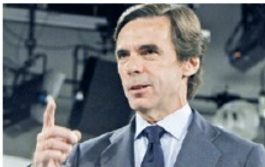
José María Aznar.