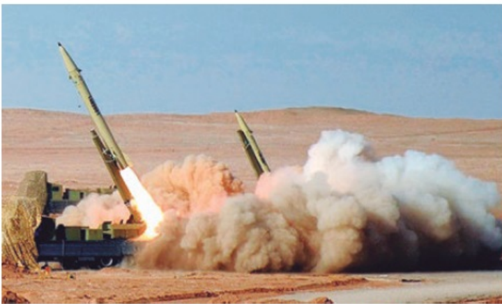
Irán lanza misiles a base militar estadounidense en Irak.

Estados Unidos está cada vez más aislado en Oriente Medio y no cuenta con el apoyo de sus aliados de la OTAN.