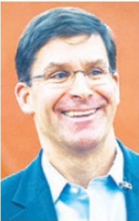
Mark T. Esper.

¿QUÉ SIGUE? ¿El asesinato del general Soleimani estuvo relacionado con la presencia militar de Irán en Irak y el apoyo de Teherán al gobierno de Bagdad en detrimento de los intereses de Estados Unidos en Irak?