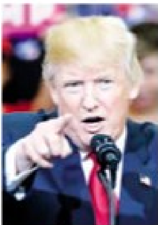
El más peligroso fue electo.

, y la diseminación de información comprometedor, el peor y más peligroso candidato de la historia del país logró ser electo.