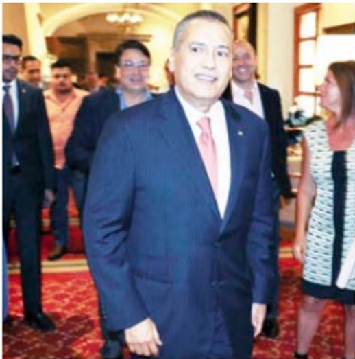
Manlio Fabio Beltrones, en pie de guerra. http://bit.ly/2wou0u9