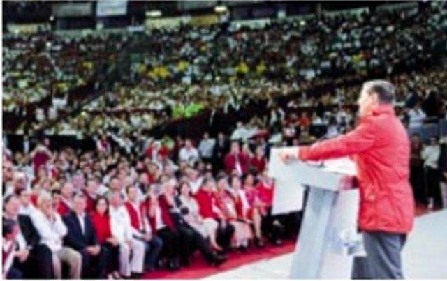
EPN La batalla por México 2018, con candidatos ciudadanos sin candados. http://bit.ly/2vSDFwv

Escrito por Rodolfo Sánchez Mena Viernes, 01 de Septiembre de 2017 12:10