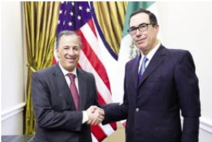
Meade-Mnuchin, acuerdan contra lavado, terrorismo y TSC. http://bit.ly/2ovB0RC