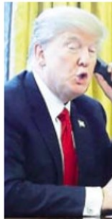
Trump-Peña Ho ht