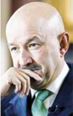
Carlos Salinas, a la oposición.

Contra 'chanulines' diputados y senadores pluris El PRI quiere evitar que los ganados por el voto