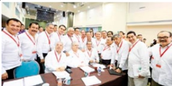
Candidato ciudadano 'simpatizante', apertura ganar 18. http://bit.ly/2uE5Kn2