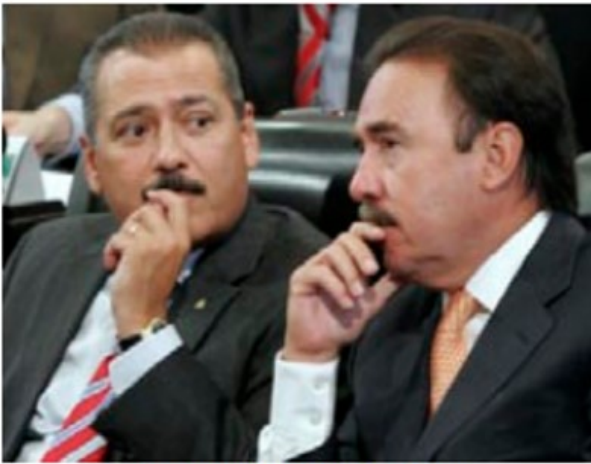
Chapulines dinosauricos, extinción

Escrito por Rodolfo Sánchez Mena Viernes, 01 de Septiembre de 2017 12:10