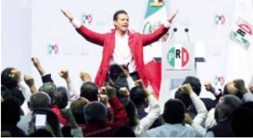
EPN, Clausura Asamblea "México gana cuando gana el PRI"

Escrito por Rodolfo Sánchez Mena Viernes, 01 de Septiembre de 2017 12:10