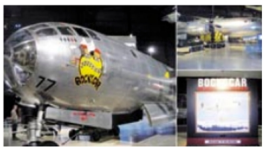
Bombardero B-29 Superfortress en un museo.