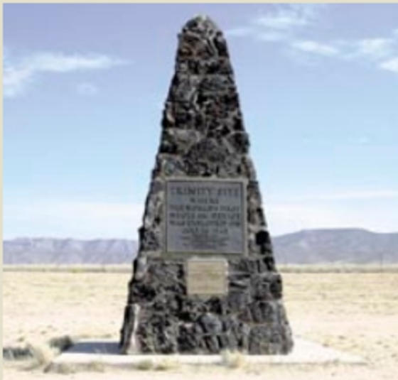
Obelisco en el sitio de la Prueba Trinity.

El piloto que lanzó la bomba atómica sobre Hiroshima falleció en Ohio (Estados Unidos) en el 2007, a la edad de 92 años. VP