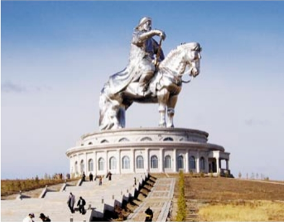
Monumento a Gengis Khan.

http://www.voltairenet.org/article196961.html