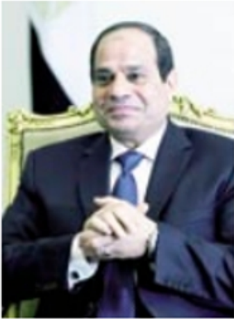
Abdel Fattah al-Sissi.