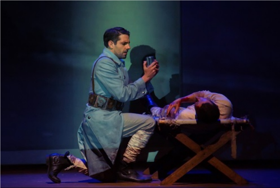
Escena de la obra El corazón de la materia, dirección Luis de Tavira

Escrito por Enrique Castillo Pesado Jueves, 22 de Junio de 2017 09:18