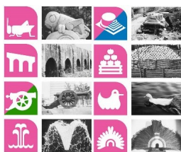
Iconografía del Metro.

CUANDO VIAJAMOS EN EL METRO alguna vez nos ha atraído la iconografía que se emplea en todas las estaciones como por ejemplo ver un pato, una serpiente, un canguro, un chabacano, un camarón, la silueta o busto de un personaje, una campana, un cántaro, un autobús, un tren, etc.