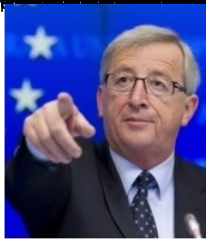
Jean Claude Juncker