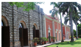
Fachada de la maravillosa Hacienda X'tepen

Numerosas familias de la Ciudad de México, Monterrey, Guadalajara, sumando viajeros internacionales, han elegido Mansión Mérida como el sitio para realizar bodas, ceremonias civiles, cocteles, desayunos, comidas, cenas, reuniones de trabajo en el patio central que luce rodeada de tonos verdes naturales y de la caída de agua que proviene de la fuente italiana como parte del bello escenario existente. Esto es un oasis de lujo y tranquilidad de sensación única, armoniosa y espectacular.