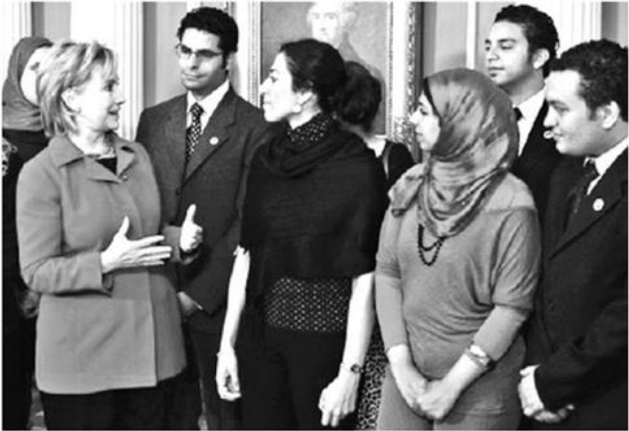
Followers of Freedom House in Washington DC (2009)

Escrito por MICHEL CHOSSUDOVSKY Lunes, 14 de Febrero de 2011 18:42