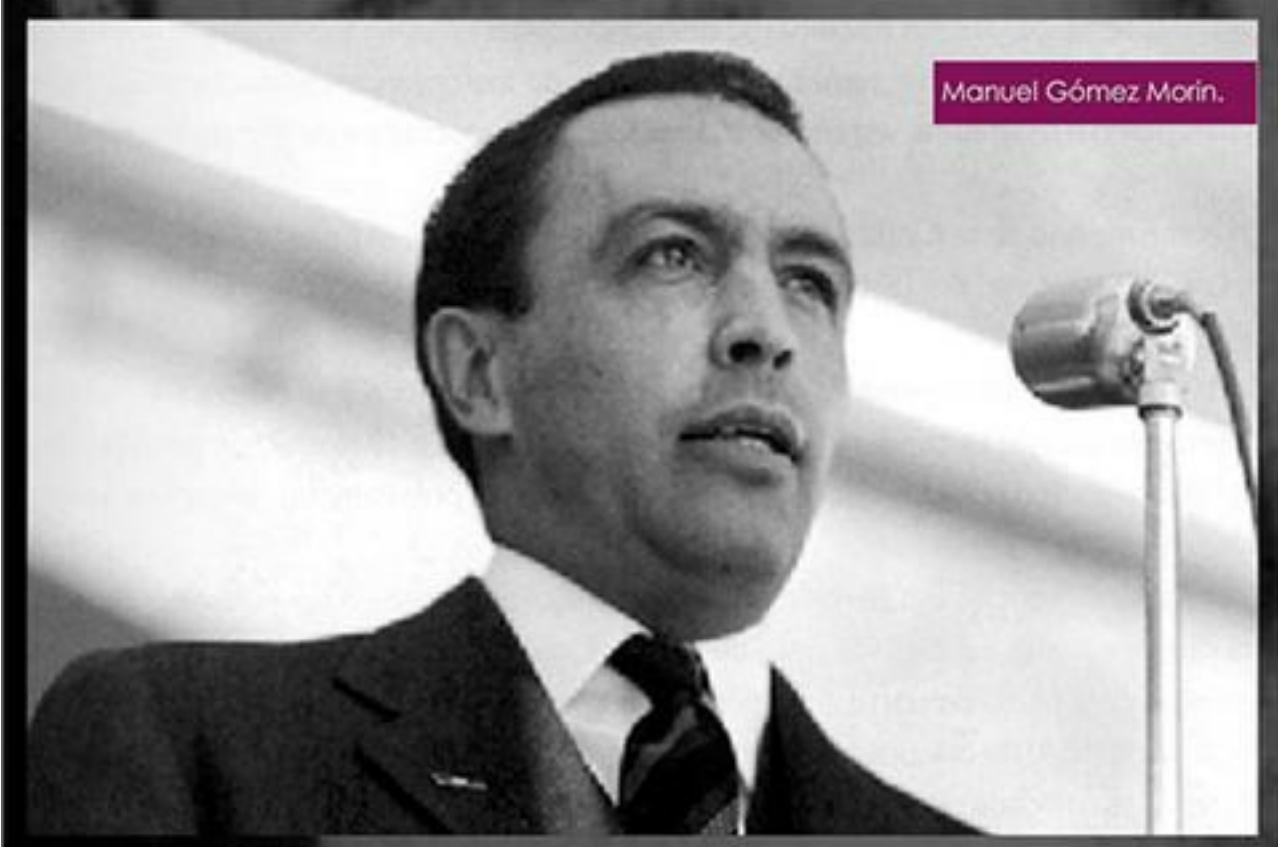
Manuel Gómez Morín.

Wikipedia: http://es.wikipedia.org/wiki/Manuel_G%C3%B3mez_Mor%C3%ADn