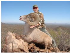
Cacería de borregos.