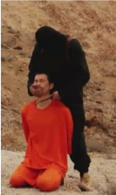
Asesinato del rehén japonés, la prensa argentina revela amenaza de Isis a Cristina Fernández