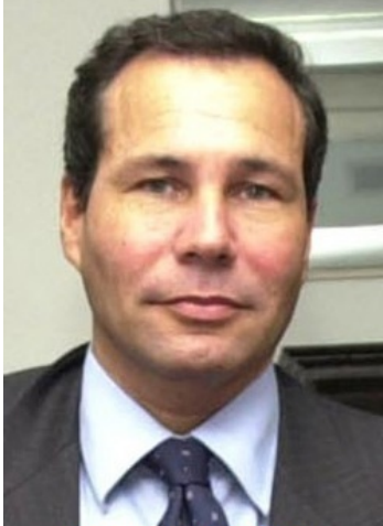
El fiscal Nisman