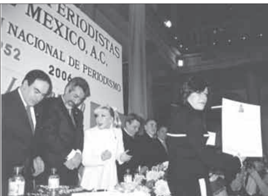
La Jornada y "La Otra Tele".