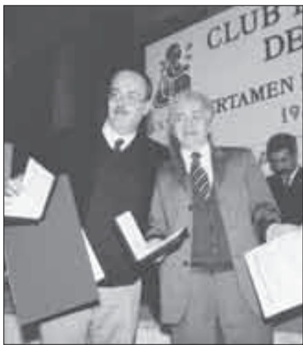
José Galán, La Jornada.