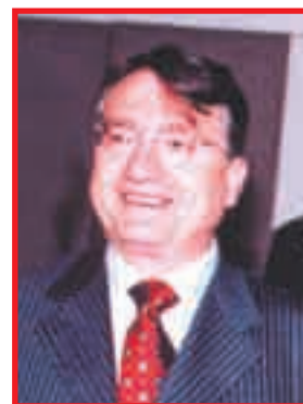
José Gutiérrez Vivó: Inconcebible intimidación del nuevo gobierno.