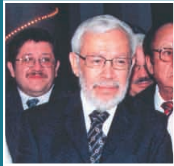
Miguel Ángel Granados Chapa.