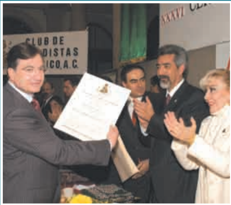
José Gutiérrez Vivó