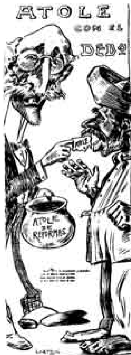
Monsieur Limantour La Sátira abril de 1911

visítanos en: www.vocesdelperiodista.com.mx