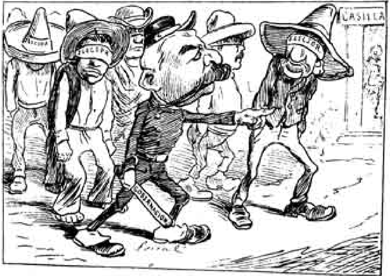
Ramón Corral visto por El Ahuizote Jacobino

No hay, pues, ni paz en las calles ni tranquilidad en las conciencias. (AGI)