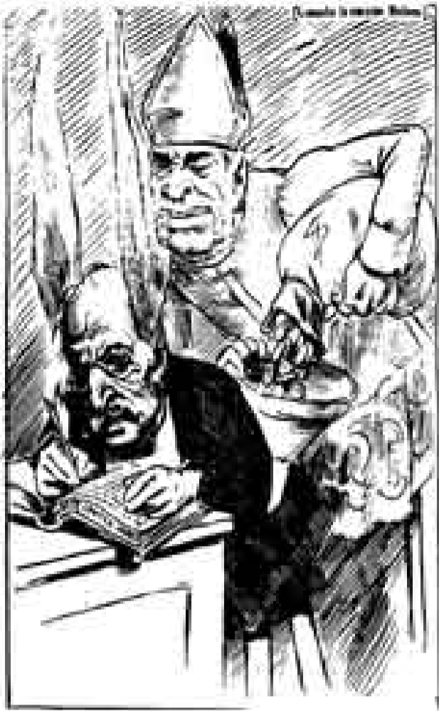
Francisco Bulnes visto por El Colmillo Público