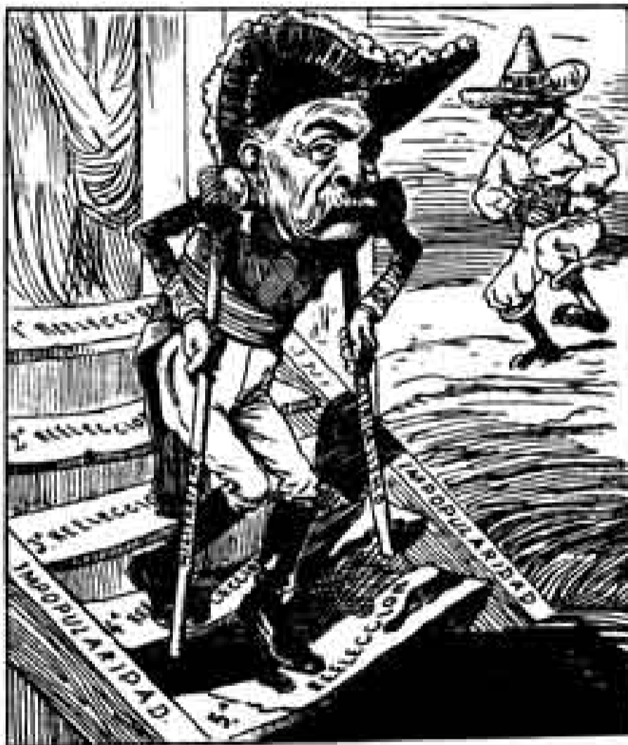
El Hijo del Ahuizote

En sus arrebatos exclamatorios, en intervenciones discursivas no programadas en su agenda, como ocurrió el pasado 9 de junio en Cajeme, Sonora, el Presidente de la República presenta subconscientemente signos de su ofuscación emocional: Primero, no atinó a precisar el plazo que separaba aquella fecha del día de las elecciones generales. Luego, se comprometió terminar su gestión presidencial haciendo muchas cosas "de aquí al 31 de diciembre"; esto es, 31 días después de cerrado su periodo constitucional, que concluye el 30 de noviembre.