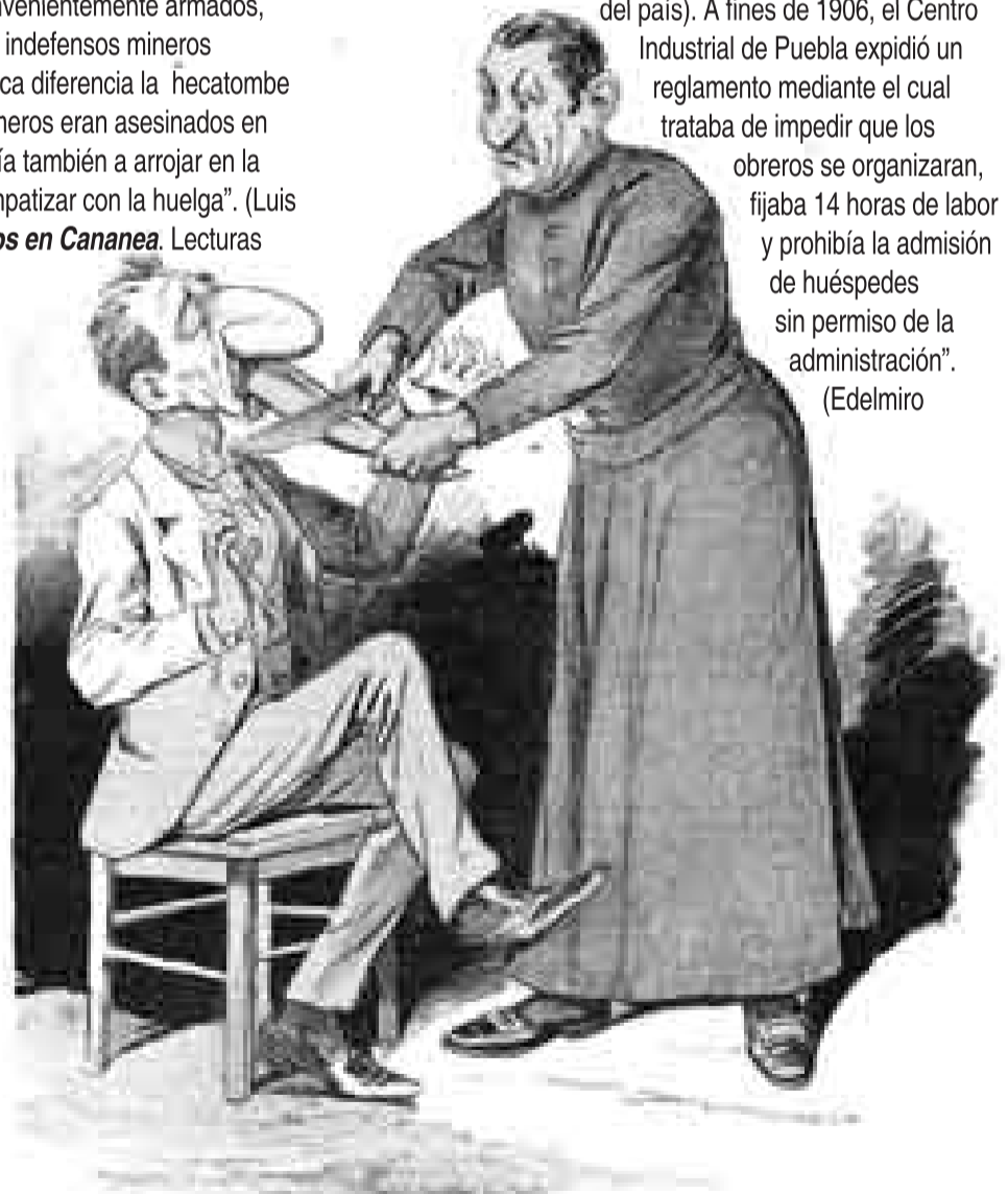
DESARMES - El de un orador.

"Pronto cundió la alarma entre los patrones (del resto del país). A fines de 1906, el Centro Industrial de Puebla expidió un reglamento mediante el cual trataba de impedir que los obreros se organizaran, fijaba 14 horas de labor y prohibía la admisión de huéspedes sin permiso de la administración". (Edelmiro