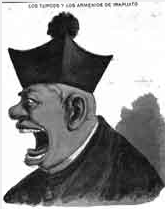
Comico octubre de 1898

¿Se puede decir más? Era el estilo ideológico-retórico de Abascal Infante. Sus héroes, y auténticos “Padres de la Patria”, entre otros, eran Hernán Cortés,