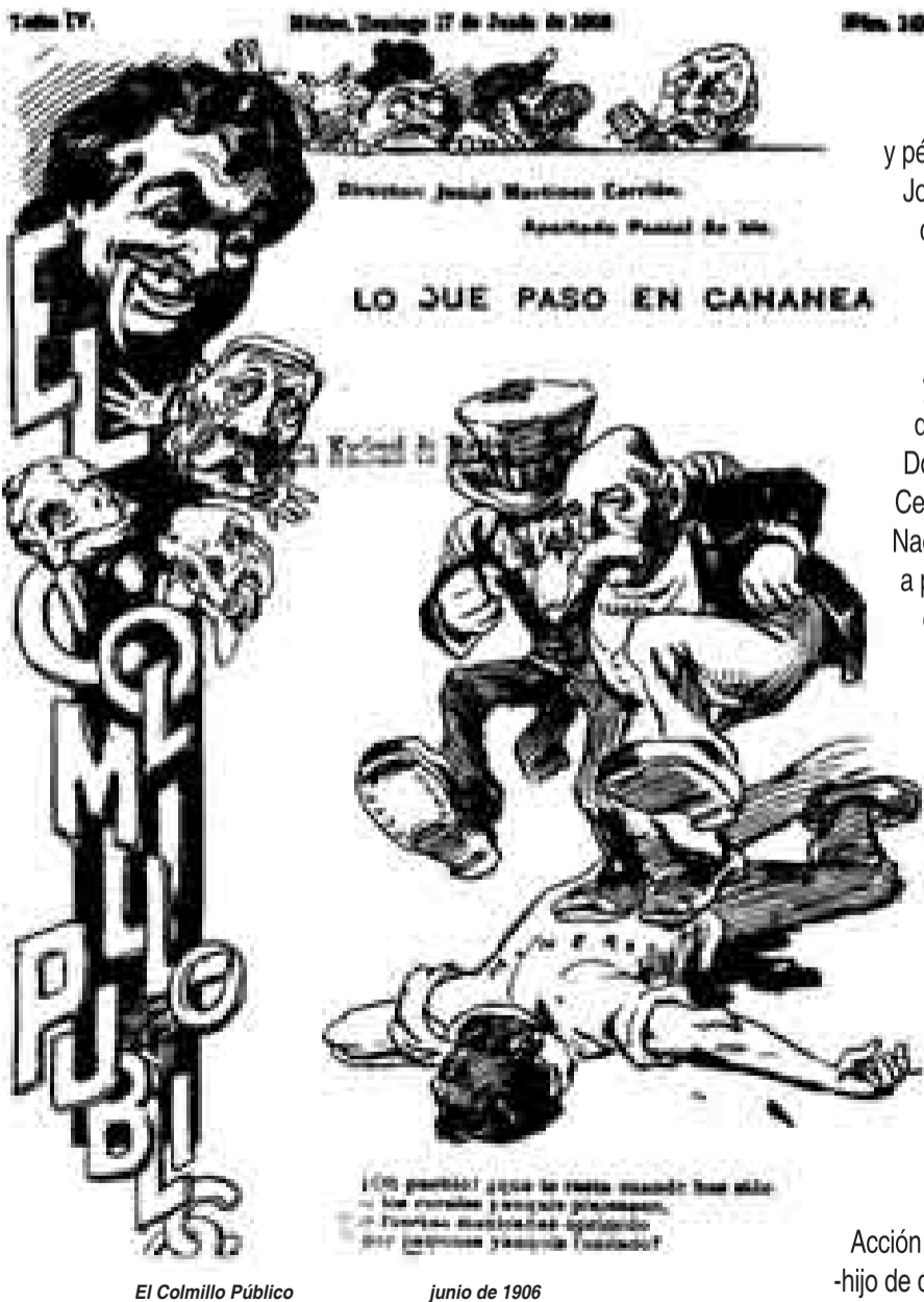
El Colmillo Público junio de 1906

apellidos porfiristas de Michoacán, como el de los Estrada Iturbide, y apoyador en la década de los cuarenta del siglo pasado de la alianza de Fuerza Popular, de origen cristero-sinarquista, y el PAN-, ha aplaudido la represión contra el movimiento sindical y popular, y se ha comprometido a continuar, en caso de llegar a la presidencia, las políticas de Fox. Ya lo decían los clásicos: Cuando muere un régimen de esas odiosas características, no se precisa la autopsia: muere por su suicidio. VP