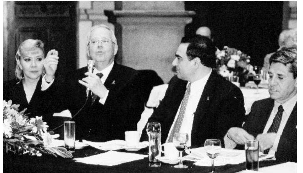
Hugo Salinas Price: Encender una Lucecita

No sería así si todo nuestro sistema financiero no dependiera, exclusivamente de sus normas y de sus valores de referencia en toda la cuestión económica. La propuesta que hace Salinas Price, desde luego, se refiere en este momento a la plata, estamos seguros que puede referirse a todos los valores de la economía real, a todo lo que producen los mexicanos con su trabajo, es decir, es una filosofía distinta, el valor de la economía debe apoyarse en lo que existe en el mercado, lo que está en posibilidad de ser intercambiado y no en abstracciones y en una cadena de especulación que han convertido los años noventa en un verdadero infierno para todos los países, tanto en desarrollo como desarrollados, los efectos 'Tequila', 'Sake' y el 'Vodka', entre otros, todos ellos no son más que resultado de apoyar la economía en abstracciones, en entelequias y tal vez esto es lo valioso de la propuesta de la Asociación Cívica Mexicana pro-Plata, desde luego, vamos a escuchar temas y debates sobre esto que enriquecerán este tema.