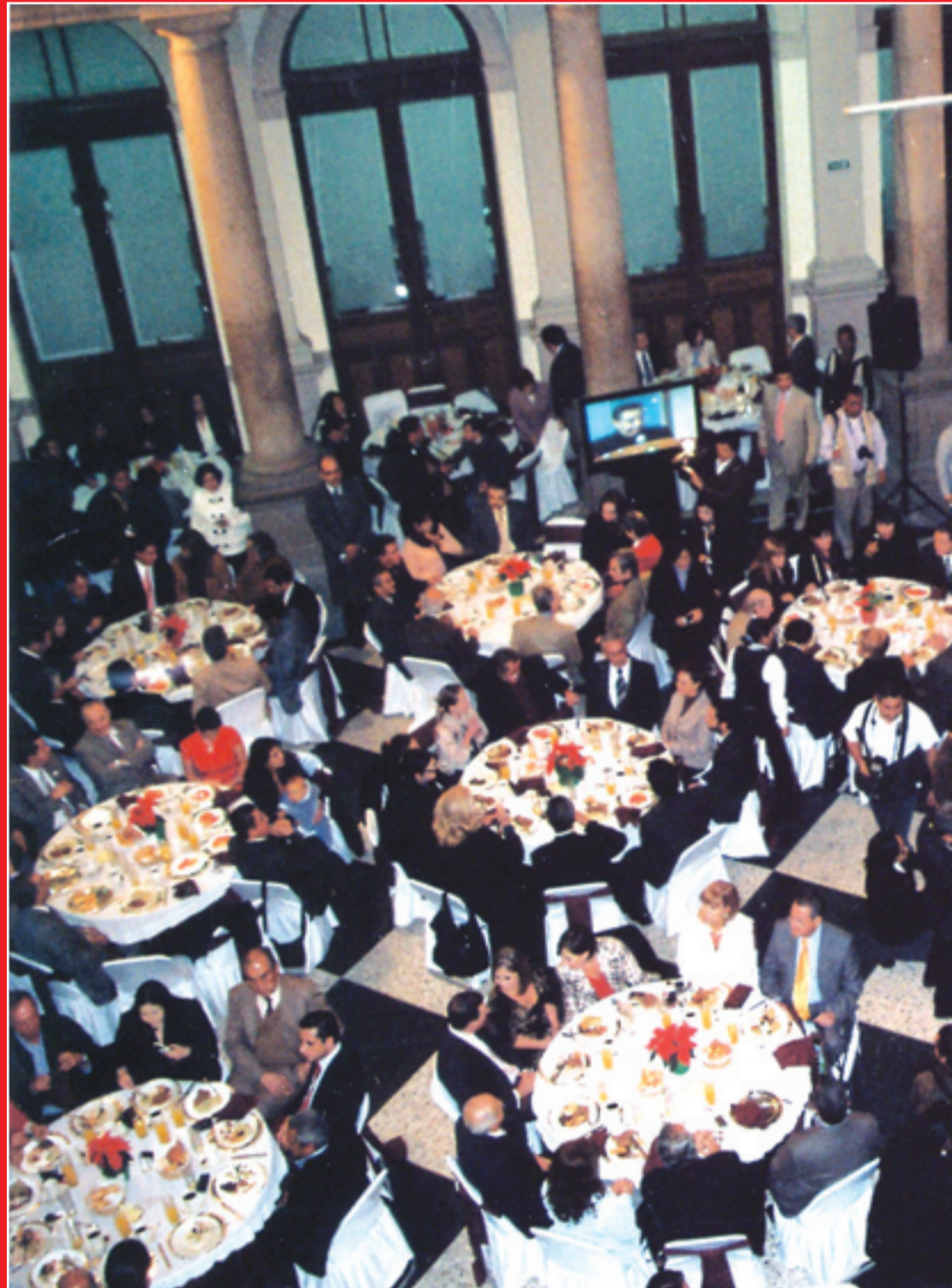
La XXXVIII entrega del Premio Nacional de Periodismo, celebrada en la casa de la Libertad de Expresión se caracterizó por el nivel de la competencia, la corrupción, la impunidad y el cerco de terror tendido por los poderes legales e ilegales de México; con lo que los periodistas se enfrentaron a la censura y a la Internet. La investigación de fondo en temas que trascendieron a nivel nacional, lo mismo que en diversas latitudes.