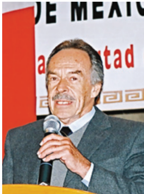
René Drucker Colín.

El país requiere, y les quiero decir que nos ayuden porque a todos nos interesa que este país se desarrolle, que sea un país competitivo, que en el mundo globalizado seamos un referente en ciertas áreas en particular y necesitamos de la ayuda de todos ustedes, porque necesitamos impulsar el desarrollo científico y tecnológico de este país. Los mexicanos en su conjunto se los van a agradecer en su futuro. Muchísimas gracias por el honor que me hicieron.