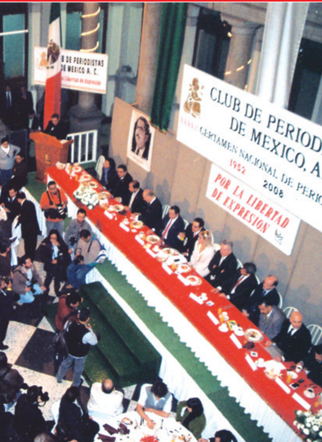
Por galardonar a aquellos comunicadores que a través del esfuerzo comprometido en su trabajo lucharon contra el silencio, ganadores lograron resultados de excelencia, todos ellos, difundidos en medios impresos, radiofónicos, televisivos y en los del orbe, fue el detonante que llevó a encontrar a los merecedores del Premio en su edición 2008. Felicidades.