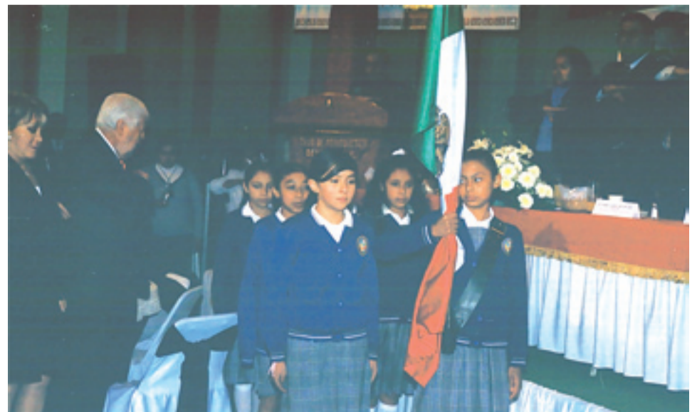
Alumnas del Colegio San Ignacio de Loyola Vizcainas portan el Lábaro Patrio durante los Honores previos a la entrega del Premio Nacional de Periodismo.